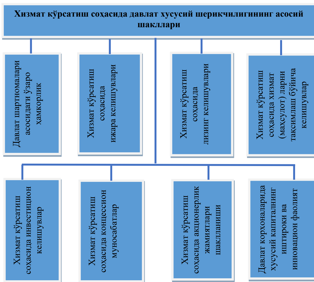
1-расм. Хизмат кўрсатиш соҳасида ДХШнинг асосий шакллари 1

Концессиядан ташқари, ДХШнинг бошқа шаклларида фойдаланиш мумкин, масалан, давлат бинолар, иншоотлар, ишлаб чиқариш воситалари кабиларни хусусий секторга ўтказиш орқали ижара муносабатлари шаклланади.